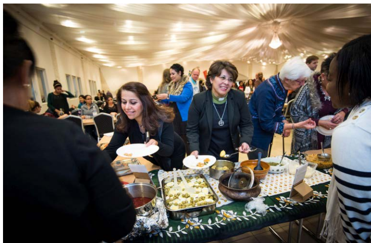
Mat från världens alla hörn serverades vid den ekumeniska festkvällen under Globala veckan i Västerås i fjol.