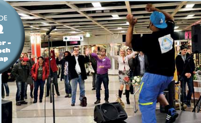
Invigning av Globala veckan i Skäggetorps centrum.

DETTA HÄNDE 2012 Över gränser - migration och flyktingskap